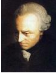
Immanuel Kant 1724-1804

Conosceremo inoltre gli albori della vita, quella vegetale.